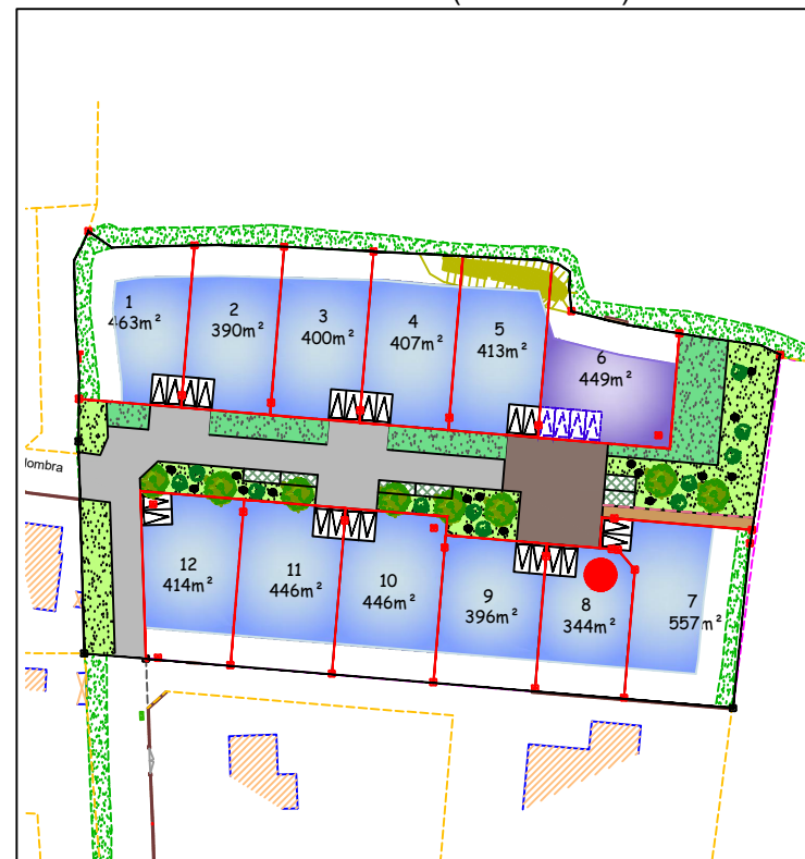
Plan de situation (sans échelle)