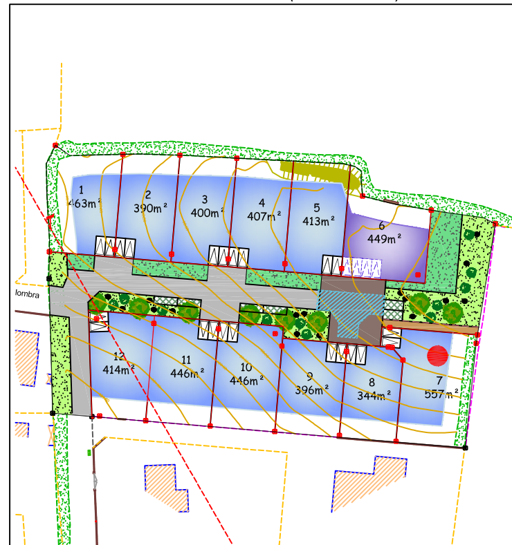
Plan de situation (sans échelle)